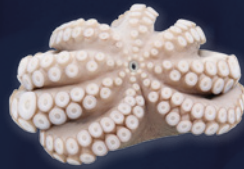
POULPE BATTU PREMIUM