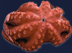
POULPE ENTIER CUIT PREMIUM