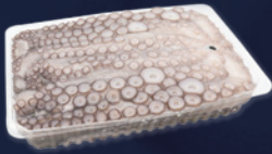
POULPE CRU PREMIUM