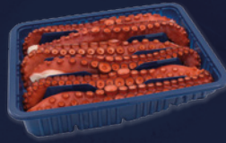
TENTACULES CUIFS PREMIUM