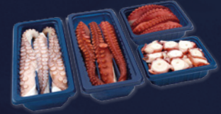
LES FORMATS DE VENTE AU DÉTAIL HAUT DE GAMME