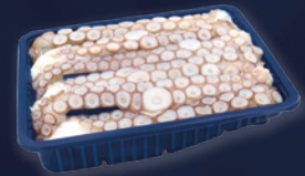
TENTACULES CRUS PREMIUM